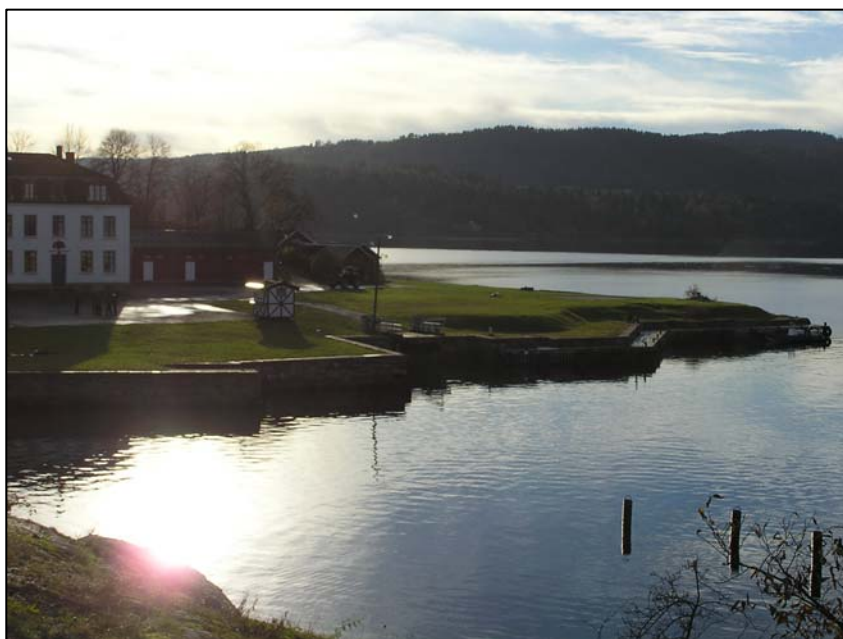
Skolekasernen på Oscarsborg festning en novemberdag i 2006.