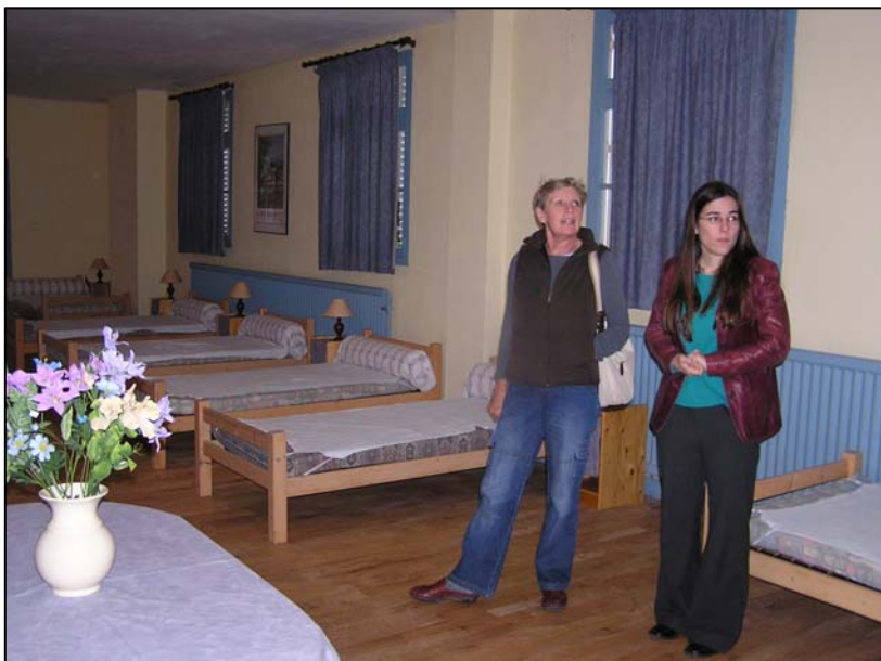
Sovesalen - åpen i sommersesongen